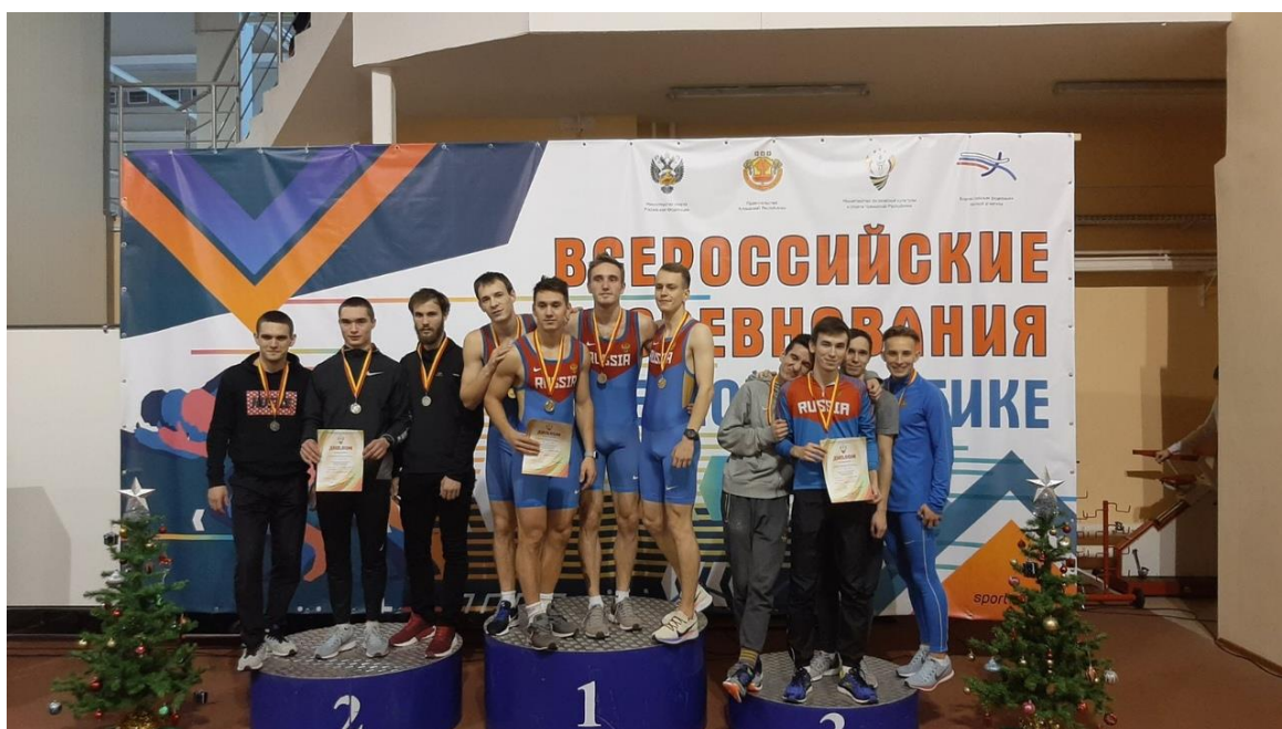
(на фото победители в эстафетном беге 4x100м сборная команда Самарской области)