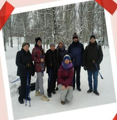
Занятия по северной ходьбе Парке Победы. Самара.