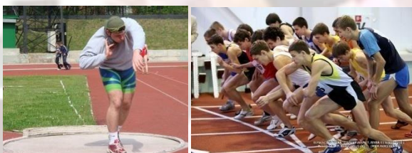
Толкание ядра Бег на выносливость

Спортивная школа развивает самый массовый и самый доступный вид спорта – легкую атлетику (спринтерский бег; бег на выносливость; барьерный бег; прыжки с разбега в длину, тройной прыжок; толкание ядра, метание копья и спортивную ходьбу).