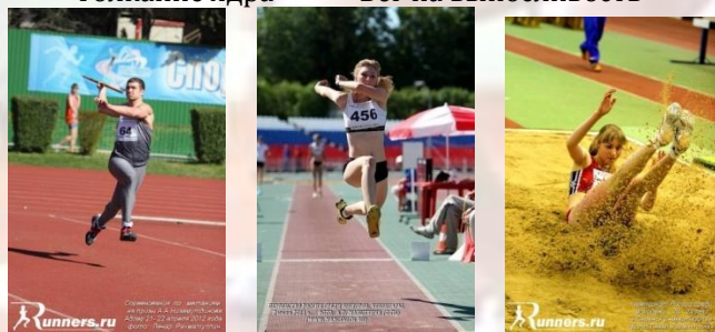
Метание копья Тройной прыжок Прыжок в длину

На данный момент школа рассматривается как одна из самых перспективных по подготовке ведущих молодых спортсменов по легкой атлетике. В ней тренируются свыше 500 спортсменов.